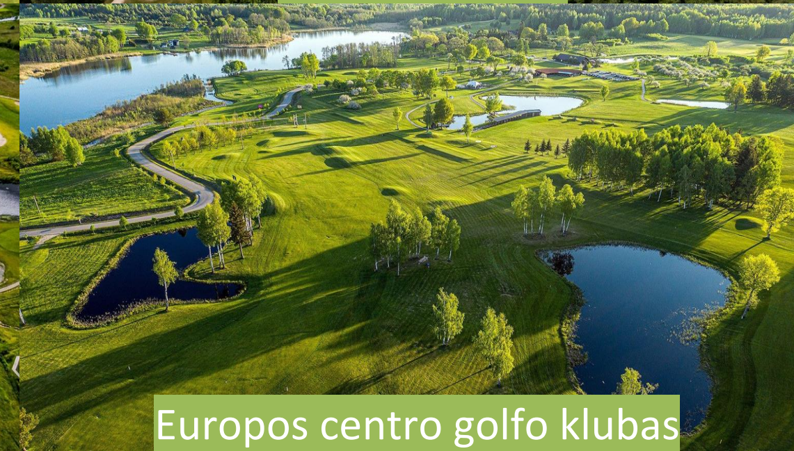
Europos centro golfo klubas