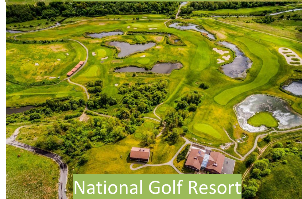
National Golf Resort