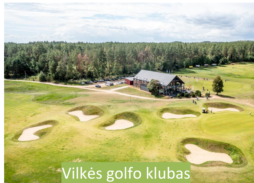
Vilkės golfo klubas