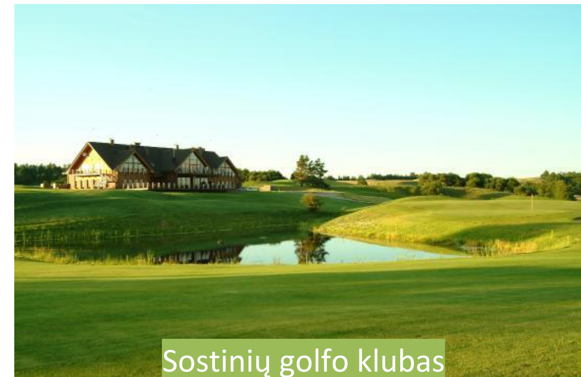
Sostinių golfo klubas