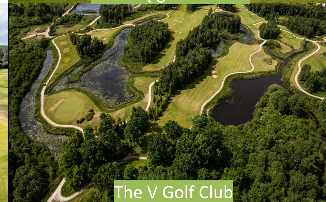
The V Golf Club